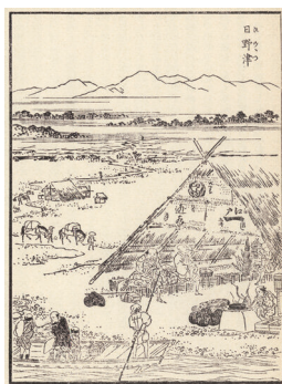
江戸名所図会（日野市所蔵）

展示室に20問の幕末と新選組の「謎（クイズ）」がありますので、展示されている資料を見ながら、全問正解を目指してください。みなさんの挑戦をお待ちしています。