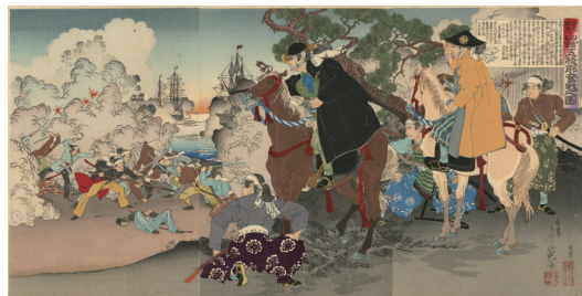
函館五稜郭奮戦之図（日野市所蔵）