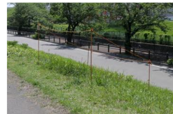
京浜河川事務所立ち合い で保護策を設置。 2024. 4. 28