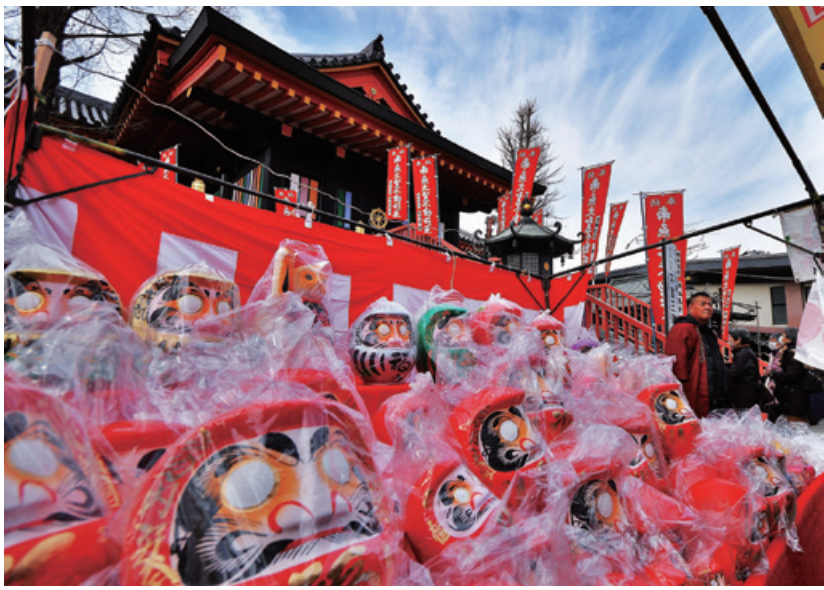
「高幡不動尊ダルマ市」 日野市観光協会主催「伸びゆく日野市写真コンクール」入賞 ※この作品は一昨年撮影されたものです。