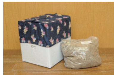
▲ダンボールコンポストセット