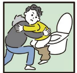
障がいや病気のある家族の入浴やトイレの介助をしている