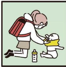
家族に代わり、幼いきょうだいの世話をしている