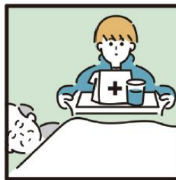
がん・難病・精神疾患など慢性的な病気の家族の看病をしている