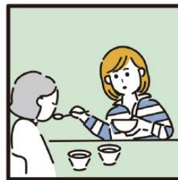
障がいや病気のある家族の身の回りの世話をしている