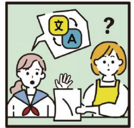
日本語が第一言語でない家族や障がいのある家族のために通訳をしている