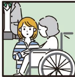
障がいや病気のあるきょうだいの世話や見守りをしている