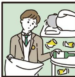
アルコール・薬物・ギャンブル問題を抱える家族に対応している