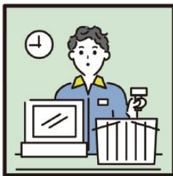
家計を支えるために労働をして、障がいや病気のある家族を支えている