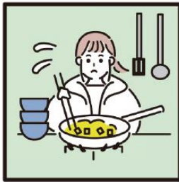
障がいや病気のある家族に代わり、買物・料理・掃除・洗濯などの家事をしている

「ヤングケアラー」とは、例えばこのようなことを“日常的”に行っている子どもたちです。責任や負担の重さにより、学業や友人関係などに影響が出てしまうことがあります。