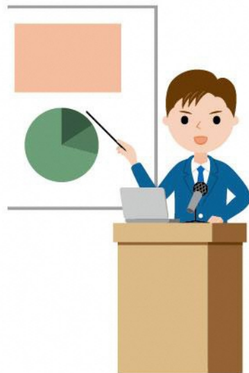
19_1演台に立つ人男性