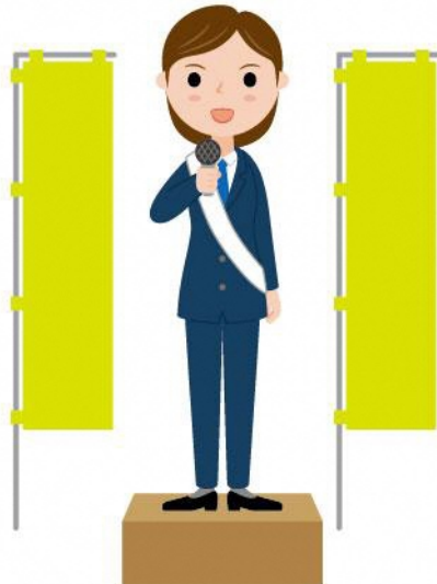
18_1立候補者議員女性