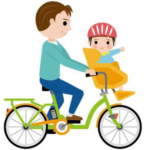
23_2乳幼児の送迎男性