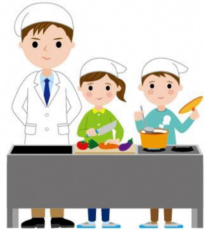
17_1家庭科の調理実習男性