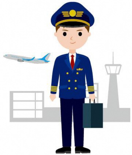
03_1飛行機のパイロット女性 03_1飛行機のパイロット男性