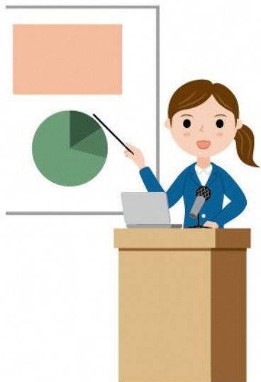
19_1演台に立つ人女性