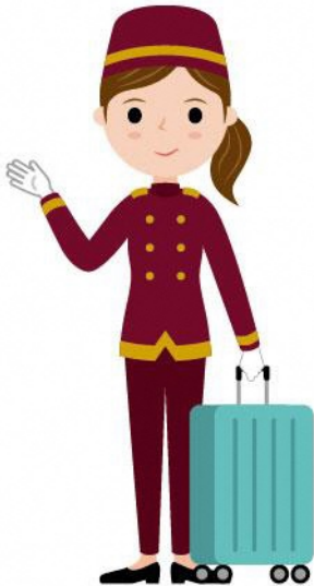
12_1ホテル従業員女性