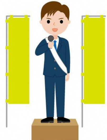
18_1立候補者議員男性