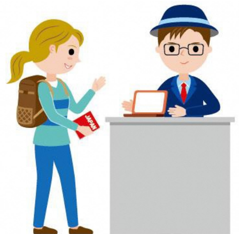
11_1外国人向け観光案内男性