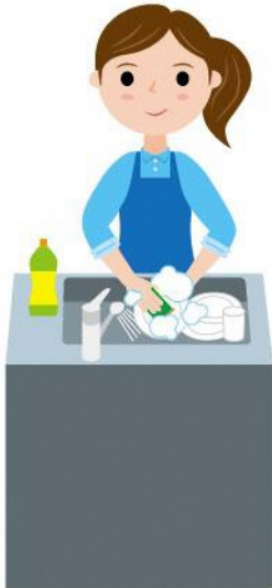
21_2食事の片付け女性