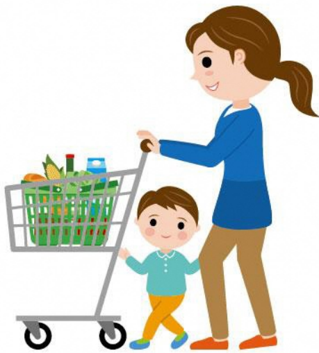
24_1食糧品買い物女性