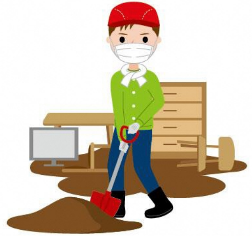
04_1防災ボランティア男性