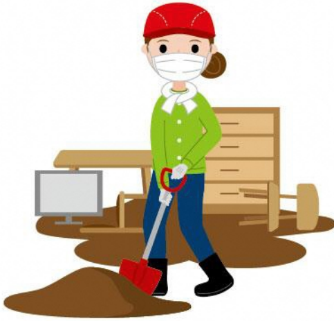
04_1防災ボランティア女性