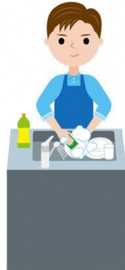
21_2食事の片付け男性