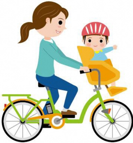
23_2乳幼児の送迎女性