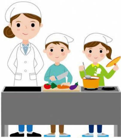
17_1家庭科の調理実習女性