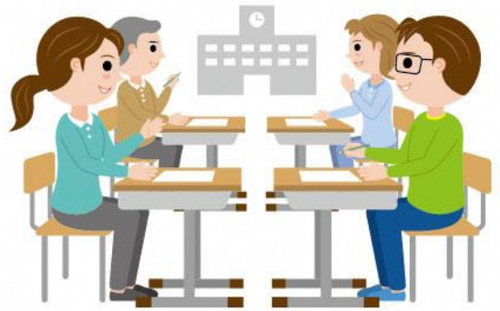
23_4保護者会への参加男性