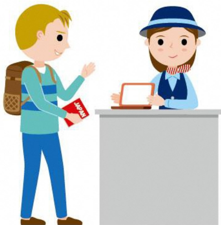
11_1外国人向け観光案内女性