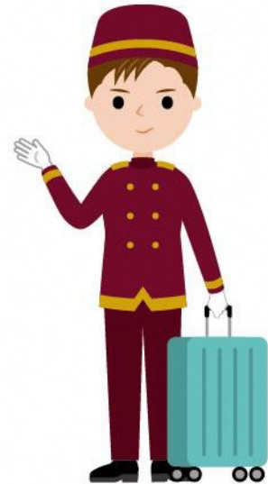
12_1ホテル従業員男性