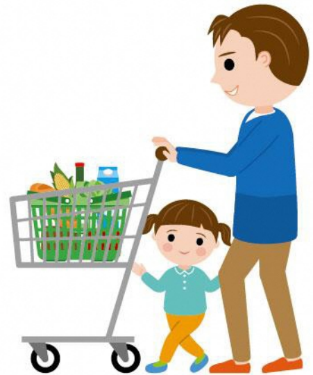
24_1食糧品買い物男性