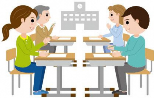
23_4保護者会への参加女性