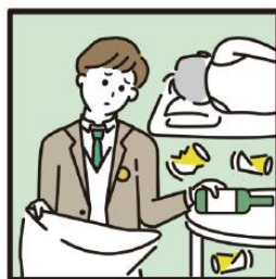
アルコール・薬物・ギャンブル問題を抱える家族に対応している