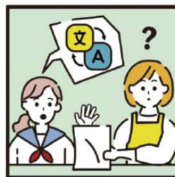
日本語が第一言語でない家族や障がいのある家族のために通訳をしている