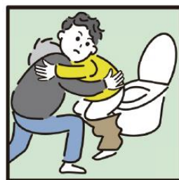
障がいや病気のある家族の入浴やトイレの介助をしている