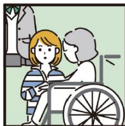
障がいや病気のあるきょうだいの世話や見守りをしている