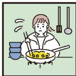
障がいや病気のある家族に代わり、買物・料理・掃除・洗濯などの家事をしている

「ヤングケアラー」とは、例えばこのようなことを“日常的”に行っている子どもたちです。責任や負担の重さにより、学業や友人関係などに影響が出てしまうことがあります。