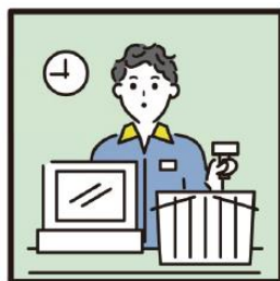
家計を支えるために労働をして、障がいや病気のある家族を支えている