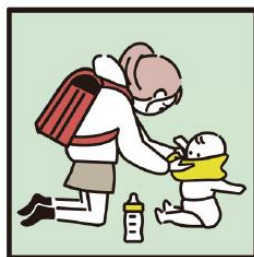
家族に代わり、幼いきょうだいの世話をしている