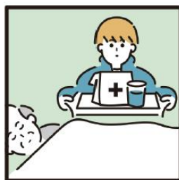
がん・難病・精神疾患など慢性的な病気の家族の看病をしている