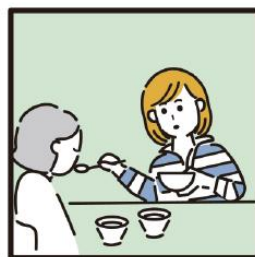
障がいや病気のある家族の身の回りの世話をしている