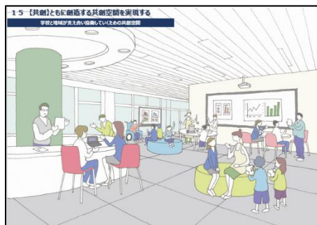
地域や社会の人たちと連携・協働した共創空間