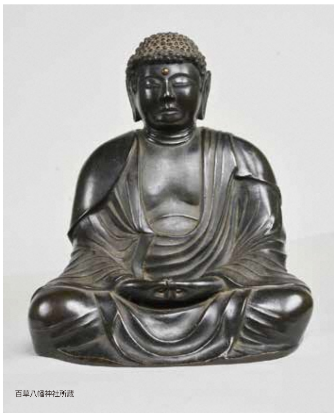
百草八幡神社所蔵