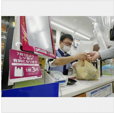
2020年7月、レジ袋の有料化を全国の小売店に義務付ける制度が始まった=東京都品川区

政府がレジ袋の有料化を小売店に義務付けてから1日で3年。コンビニ各社でレジ袋を辞退する客の割合が、 有料化後の3年間も増加傾向が続いていることが共同通信の聞き取り調査で分かった。直近では各社とも客の7～8割が辞退。 脱レジ袋の動きが今も広がり、環境意識が根付いていることがうかがえた。一方、店舗周辺でごみが増えるなど環境悪化の誘因となるケースもあり、対応を迫られそう