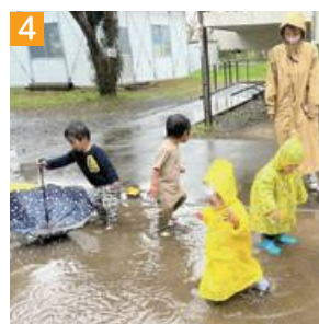
4 雨の日だって楽しく遊べる♪