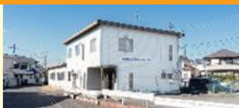
ひの市民活動支援センター 場大字日野1369-27

地域活動の相談・支援を行っているひの市民活動支援センター。今後、勤労・青年会館および豊田駅周辺公共施設との機能集約を予定しています。つきましては、リニューアル後の新センターの名称案を募集します。施設内に投票箱を設置していますので、皆さまのアイデアをお寄せください。