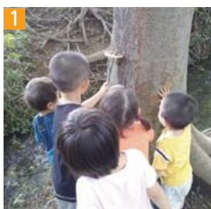
1 兄弟参加もあるので、自然と異年齢交流も

落川交流センターを拠点として活動していた複数の任意団体で立ち上げました。野外自主保育やプレーパーク、田んぼの活動を通して、この地域での多世代交流が盛んになるように事業を展開しています。