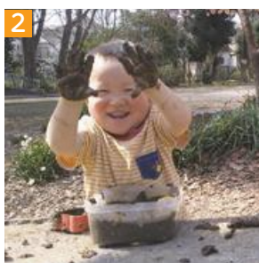
2 泥んこになってもへっちゃら