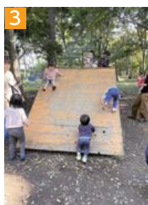
3 皆大好き！すべり台