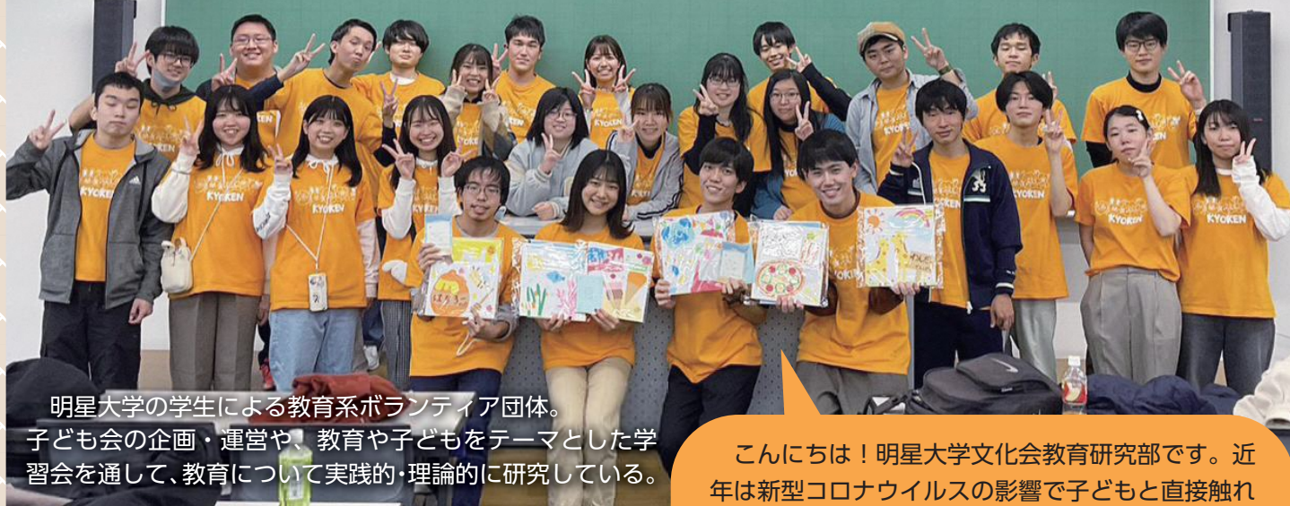
明星大学の学生による教育系ボランティア団体。 子ども会の企画・運営や、教育や子どもをテーマとした学習会を通して、教育について実践的・理論的に研究している。

明星大学の教育研究部は、程久保を拠点に活動している三井台つくし子ども会、わかば子ども会の企画・運営を行っています。保護者と連携して、子どもたちと一緒に、工作やレクリエーション、サマーキャンプやハロウィンパーティーなど季節に合わせた、さまざまな活動を展開しています。