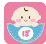
ぼけっとなびアプリ