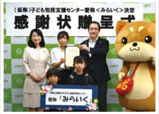
「みらいく」提案者へ、市長より感謝状を贈呈しました。