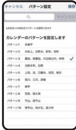
お住まいの地域に 合わせて設定可能!