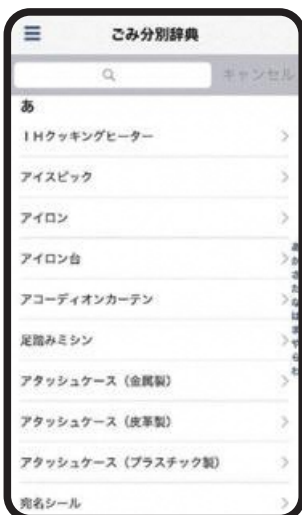
約900品目を掲載している、ごみ分別辞典を搭載! (随時更新中)品目も簡単に検索可能!