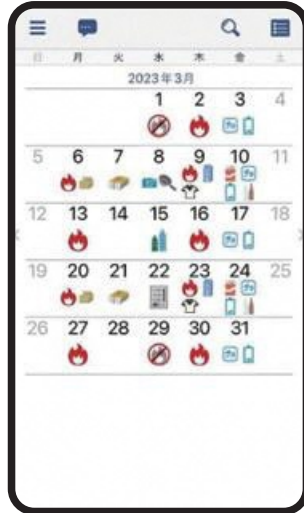
カレンダーとしても 利用できます!