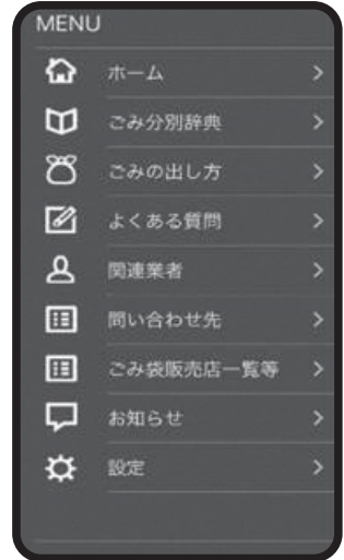
ごみ出しに役立つ 機能が満載!