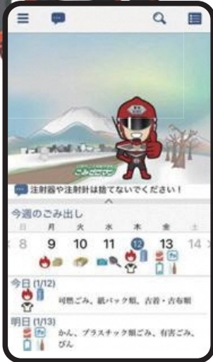
トップページで今日の ごみ出しが一目で分かる!