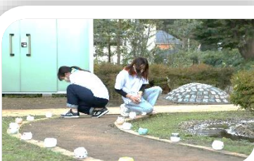
オリジナルキャンドルを並べて