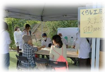
みんなでワイワイくらし工房