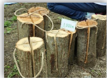
日野産材スウェーデントーチ