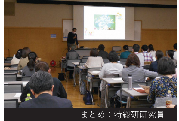
まとめ：特総研研究員