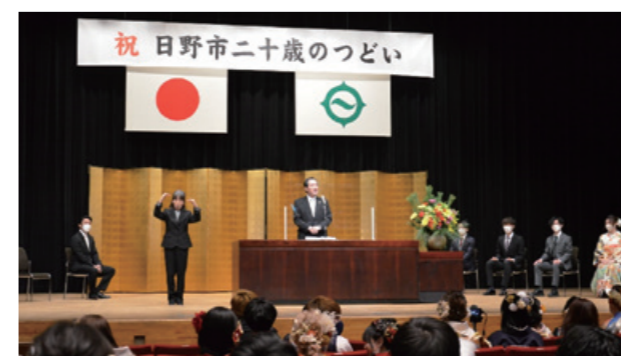
▲市長あいさつの様子

1月9日に、ひの煉瓦ホール(市民会館)で、「日野市二十歳のつどい」を開催しました。午前と午後の2回に分けて行われ、1,145人が参加されました。