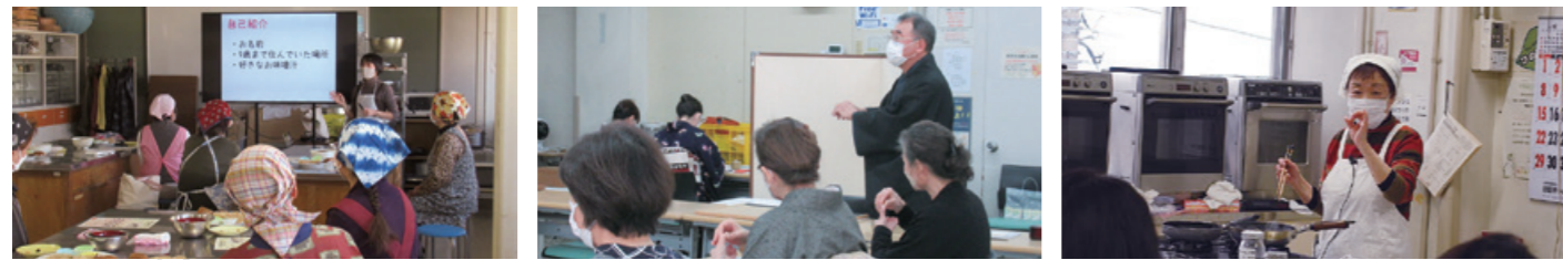
▲味噌玉ワークショップ

「ひの市民大学」は、市民がバラエティーに富んだ内容の講座を企画・運営し、学びの場を市民に提供する事業です。また、日野市周辺の大学と連携して、大学の授業を市民に届ける講座も行っています。皆さまもぜひ、企画運営に参加しませんか？