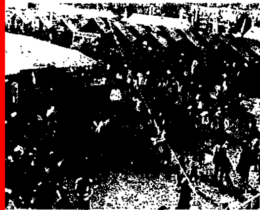
▲昨年の産業まつりから

●農産物展 市内で産された農産物を一堂に集めた品出しを行います。同時に、盆栽、花と、野菜、漬けもの等の販売を行います。 ●商工業展 農工商業者による生産品の展