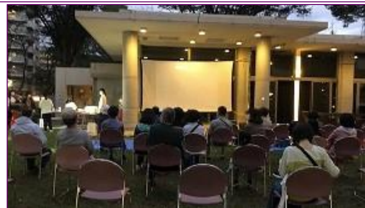
参考R3: 星空映画上映会(実写版蛍の墓)