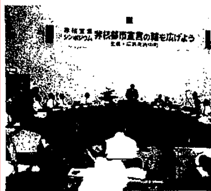
▲広島県府中町で開かれたシンポジウム

去る八月五日、被爆地広島にて、初の「非核宣言シンポジウム」が開催され、参事長をはじめ、市民から九市町の市長が参加、反核に向けて地方自治体の役割を果たす。 このシンポジウムは、反核・非核宣言の呼びかけ、