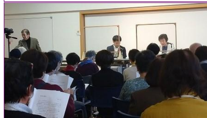
参考R3: 多摩文学の会(エッセイ・戦争体験記朗読会)