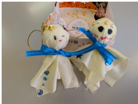
楽しかった「てるてる坊主作り」(6月17日実施)