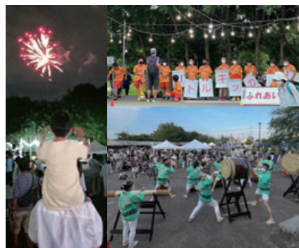
▲ステージ発表とサプライズ打ち上げ花火