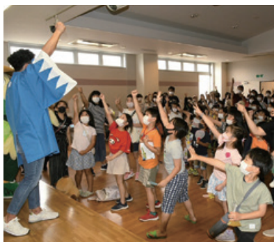
▲じゃんけんマンと勝負！

改めて、お祭りは地域をつなぐ架け橋となり、人と人がつながるきっかけになると実感しました。来年度も「ひらやまえんにち」を開催できるよう地域の方々と力を合わせて活動していきます。