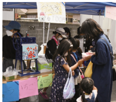
▲平山小学校児童による販売