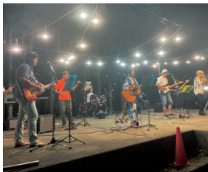
▲自治会役員で構成されたバンド UNDER FIELD

ステージでは日野太鼓の演舞や、地域の音楽サークルの演奏、スポーツクラブのアピール大会、自治会役員バンド「UNDER FIELD」のライブなどさまざまな催しでにぎわい、最後はサプライズの打ち上げ花火で締めくくられました。