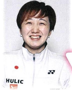
車いすのバドミントン選手

日野市南平在住の山崎悠麻選手は、小学2年生からバドミントンを始めました。 東京 2020 パラリンピックに出場し、女子ダブルスで「金メダル」を、女子シングルスで「銅メダル」を獲得されました！ 先日開催された 4Nations Para Badminton International 2022 でも、女子シングルス WH2 において「優勝」しています！