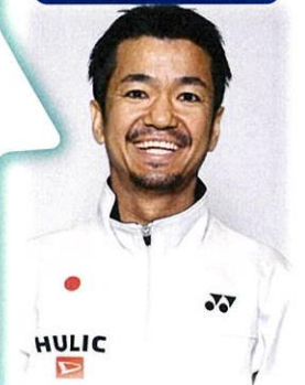
立位のバドミントン選手