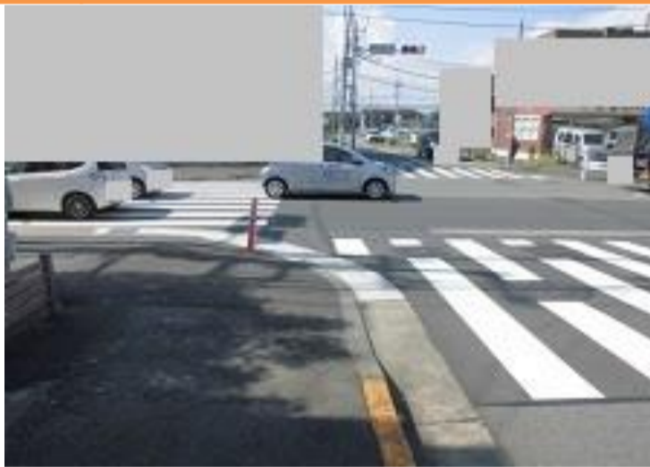
3 南平二丁目65番地先南平四丁目交差点

【現状】 交通量も利用する児童も多い交差点。歩道上にポストコーンが設置されているが、内輪差で乗り上げる車両があり児童が巻き込まれる危険がある。 【対策メニュー】 現在設置してあるポストコーン1本を2本に増設しました。