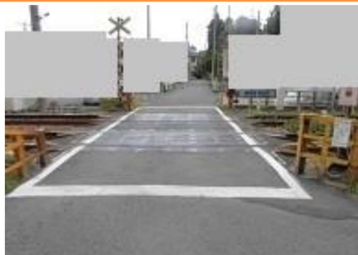
2 南平四丁目7番地先 京王線踏切手前の溜まり

【現状】 変則型のT字路で踏切末の車があると、児童の待機場所がなくなってしまふ。 【対策メニュー】 掠れている既設路側線の補修を検討します。