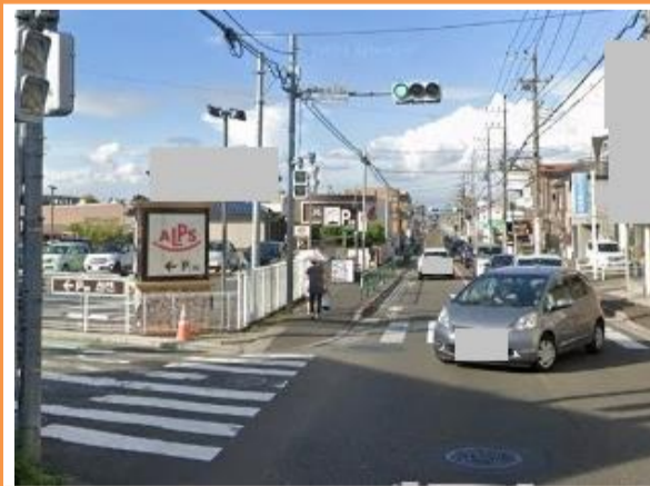
11 平山四丁目1番地先 南平住宅入口交差点

【現状】 市道から都道へ出る左折車両が多く、歩道通行中の児童が巻き込まれる危険がある。 【対策メニュー】 曲がり箇所注意喚起のためポストコーンを設置しました。