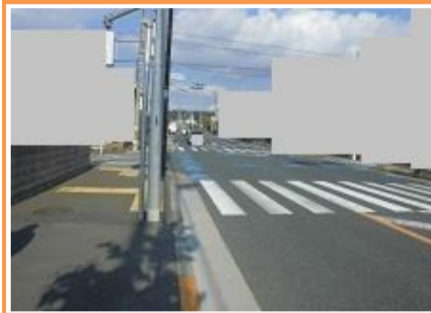
9 平山五丁目20番地先 平山城址公園駅入口交差点

【現状】 北野街道から駅方面に進入する車両がスピードを落とさず右左折するため危険である。 【対策メニュー】 平山城址公園駅入口交差点から駅方面に向かう車両に対して「歩行者横断注意」等の看板を信号柱に設置しました。