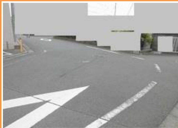
10 平山五丁目38番地先 歩道のない狭隘道路

【現状】 平山腎クリニック脇カーブの車の通行量が増えた。車とすれ違うときに車との距離が近く危険。 【対策メニュー】 掠れている既設の路側線、交差点マークの補修を検討します。