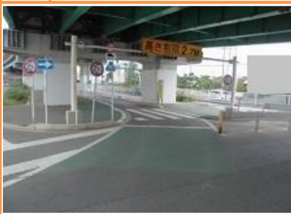
8 平山五丁目35番地先 平山陸橋下地下道入口の横断歩道

【現状】 横断歩道があるにもかかわらず地下道に進入する車両も直進する車両もスピードを出して通過するため危険である。 【対策メニュー】 地下道入口手前に設置された桁下高さ制限の標識支柱に「スピード落とせ」等の注意喚起看板を設置しました。