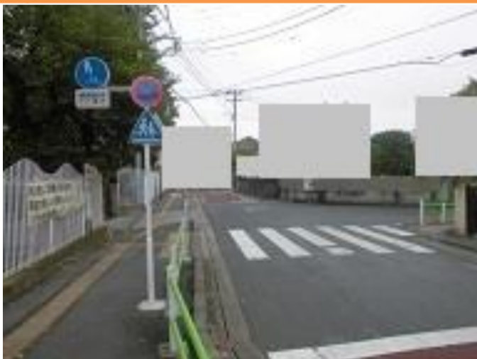
3 高幡526番地先 小学校前の横断歩道

【現状】 車、自転車、歩行者が多く危険である。 【対策メニュー】 横断歩道手前にカラー舗装もされており、歩道にガードレールも設置されている為、対策の実施は見送りとします。