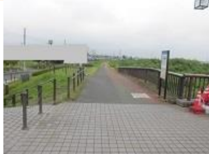
2 万願寺六丁目1番地先 浅川土手の歩道

【現状】 ・自転車がスピードを出して、運転しているため危険。 ・雨天時の浅川の氾濫が危険。 ・草が成長してくると道が狭くなり危険。 【対策メニュー】 ・令和6年度にふれあい橋の修繕工事を予定しており、修繕工事完了後に周辺道路の補修を検討します。 ・市内の堤防道路脇の草刈りは、年3回(6月頃、9月頃、12月頃)実施しております。