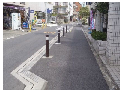
社会実験により波打ち歩道を解消し、部分的に車いすがすれ違いできるように整備された幹線市道Ⅱ-5号線