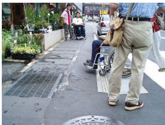
歩道の段差・勾配の解消が必要とされた区間（落川通り）