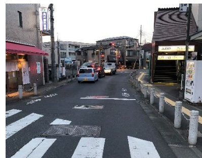
歩道と視覚障害者誘導用ブロックを整備した百草園駅前