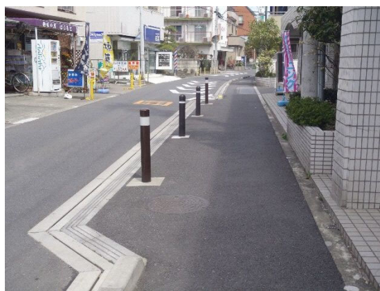
部分的に車いす使用者がすれ違いできるように歩道を整備