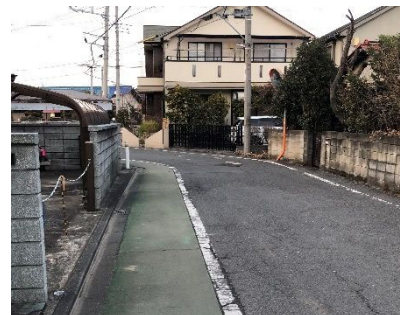
安全な歩行空間を確保するため路面標示やカーブミラーを設置