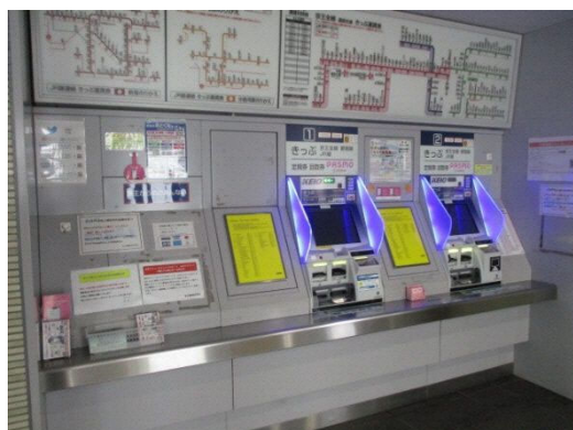
蹴込みが確保された券売機