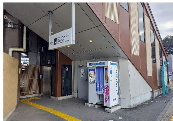
新たに整備されたエレベーター（南口）