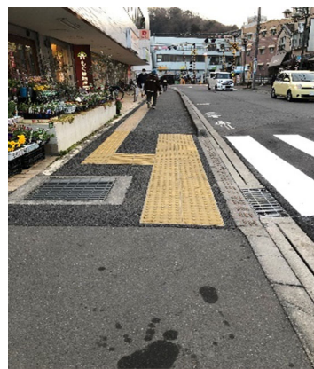
歩道の段差・勾配の解消された落川通り