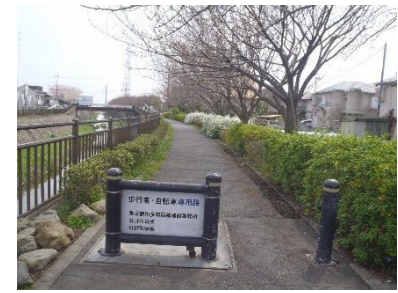
程久保川沿いの通路と一体となった生活関連経路の整備