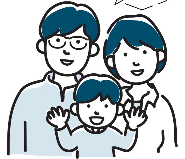
日野市生涯学習推進基本構想・基本計画 日野まなびあいプラン(令和4年度～8年度)