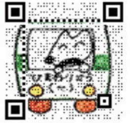
▲アンケートQRコード

市立図書館の新しい基本計画と一緒に考え、意見を述べてくださる策定委員を募集します。 対象 5月から計画策定完了まで(令和5年3月) 対象 次のすべてに該当する18歳以上の市内在住者 ①年6回程度の会議に出席できる ②図書館を積極的に利用または利用したいと思っている ③日野市の他の公募委員でない 対象 若干人 日 4月20日(水)(必着)までに〒191-0053豊田2-49-2中央図書館図書館基本計画担当へ郵送、Eメール(✉lib-event@city.hino.lg.jp)または市内図書館へ持参。作文「私の理想の図書館」(800字以内)、住所、氏名、年齢、職業、電話番号を記入※持参の場合は各館の休館日を除く