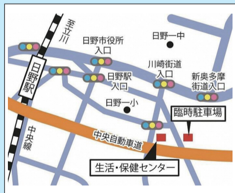
生活・保健センター