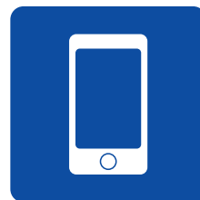
インターネットの ライブ中継を視聴