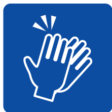
拍手による応援を