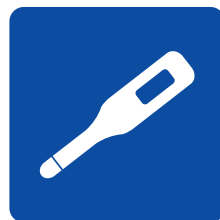
体調が悪いときは 観覧しない