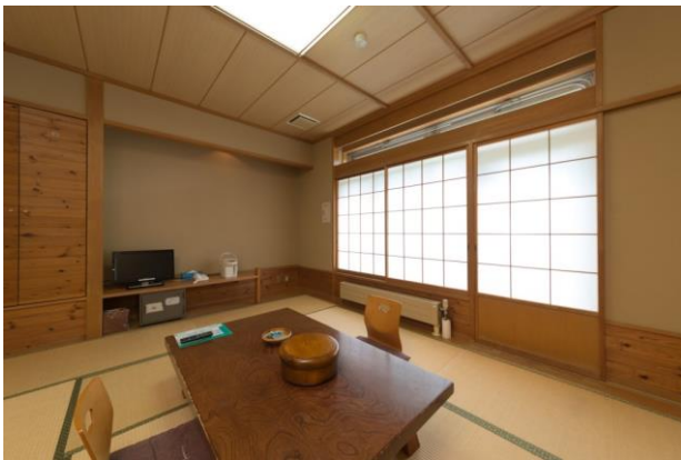
【1階 2階 客室:一般宿泊用】