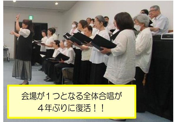
会場が1つとなる全体合唱が4年ぶりに復活！！

今年度は、令和5年8月6日(日)、星槎国際高等学校をはじめとする多く若い力とともに様々な世代が考える平和へのメッセージを届けました。朗読・合唱など、平和を願う市民の方々の取り組みを通して、参加者の皆さまも「戦争」や「平和」について考える意義深い時間となったのではないのでしょうか。