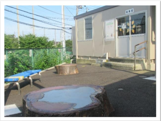
整備された保育室前

まだ、名前はありませんが現在、生涯学習のオリエンテーリングに来ている明星大学の学生たちに投票してもらい、後日決定する予定です。どのような名前になるか楽しみにしててください。