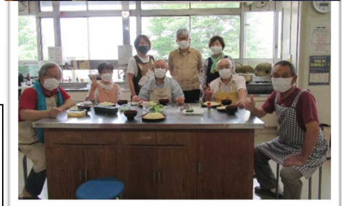
「二八そばの会」の皆さん

公民館だより編集委員会では、掲載希望サークルを募集しています。 サークルの魅力を取材に伺います！ ぜひ中央公民館までご連絡ください。 電話 042-581-7580