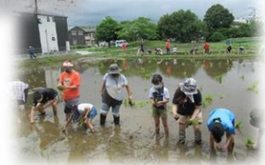
▶新町会場の田植えの様子