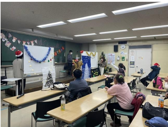
▲令和3年度クリスマス定例会の様子

青年・成人学級では随時仲間を募集中です。詳しくは日野市中央公民館までお問い合わせください。