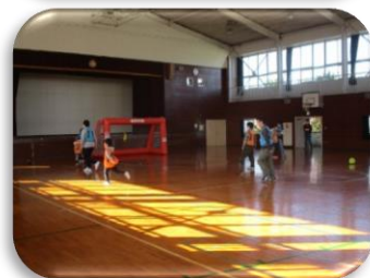
サッカー教室の様子