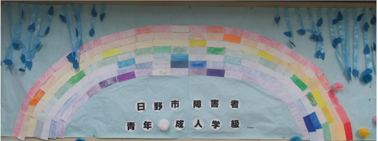
▲令和2年に作成された「虹プロジェクト」。コロナ禍で皆が会えない中で往復はがきを使って作成