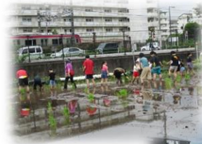
◀南平会場の田植えの様子