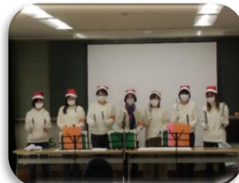
クリスマス会の様子