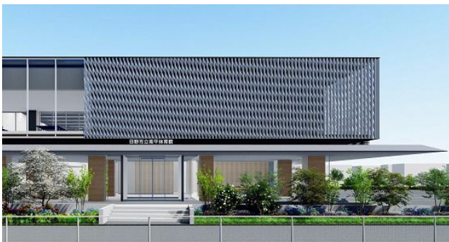
▲完成イメージパース：京王線側より