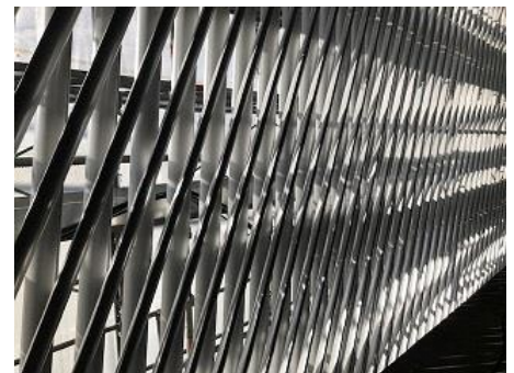
▲アルミルーバー：建物から見る