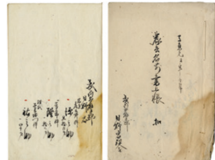
▲農兵名前書上帳控