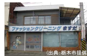
栃木県栃木市(空き店舗) 譲渡価額約240万円