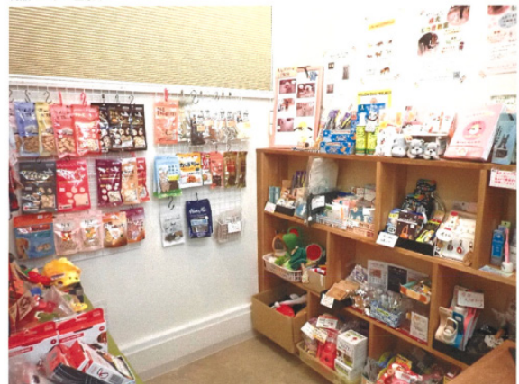
物販コーナー全景 ↓

店舗改修計画をもとに、利用者が手に取りやすい物販スペースを実現、売り上げUPにつながった。