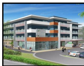
ラペ日野 120床 程久保 2-27-1 042-506-5078