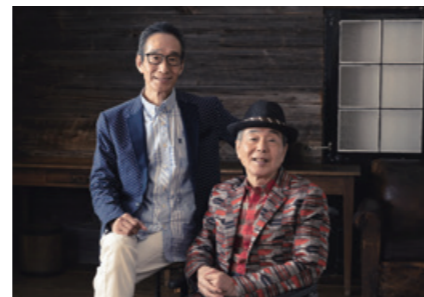
赤レンガプロジェクトは、気軽に 楽しめる芸術、文化、エンターテイ

コメントを提供する市民プロジェク トです。この赤レンガプロジェクト の10周年を記念して、ビリー・バン バンのコンサートを開催します。 日時 2月23日(祝)14:00から 会場 ひの 煉瓦ホール(市民会館) 出演 ビリー・ バンバン 定員 1,000人 費用 3,000円 (全席指定) チケット販売 市民会館、 七生公会堂、e+(イープラス)で 間 文化スポーツ課(☎514-8462)