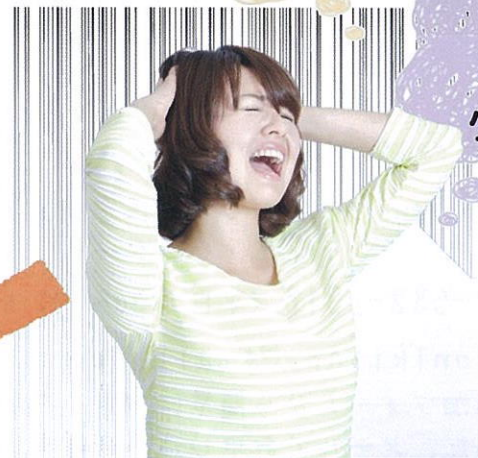
西川さんの話を聞く前の人