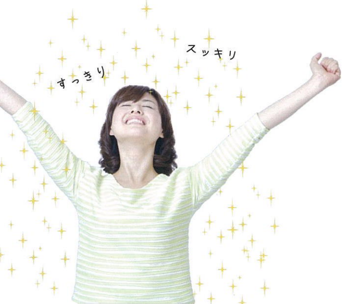
西川さんの話を聞いた後の人