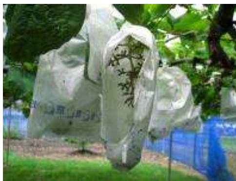
アライグマによるブドウの被害※2