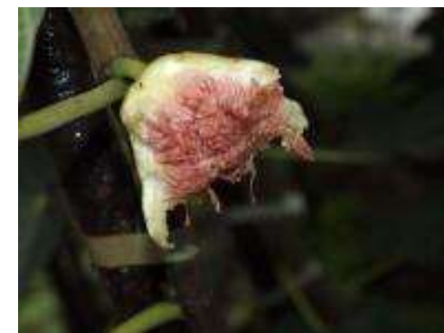
ハクビシンによるイチジクの被害※2