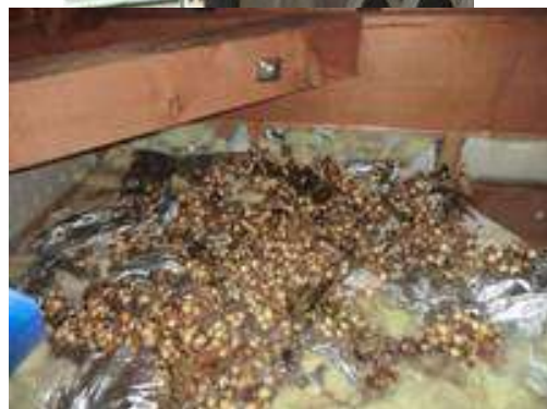
ハクビシンによる天井裏のフン害※1