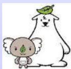
エコアラ・エコクマ