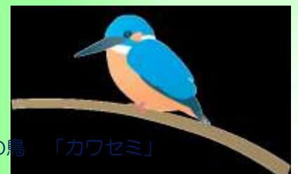
日野市の鳥 「カワセミ」