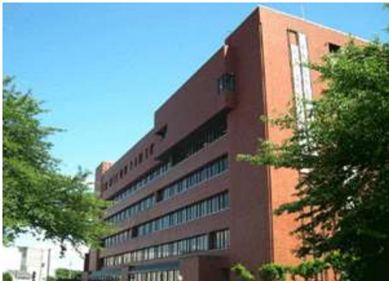
日野市役所 本庁舎