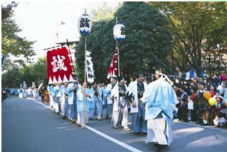
「新選組まつり」の様子