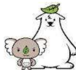
エコアラ・エコクマ