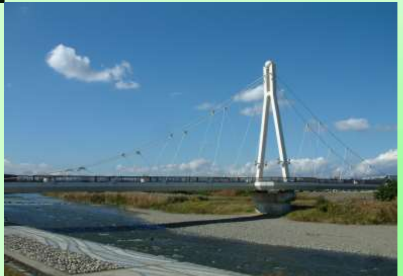
浅川とふれあい橋 (万願寺歩道橋)