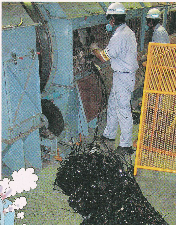
▲不燃ごみ回転式選別機に絡みついたテープ類を取り除くクリーンセンター職員

排出方法の詳細は裏面のとおりです。市として再発防止に全力をあげて取り組みますので、市民の皆さんのご理解とご協力をお願いします。