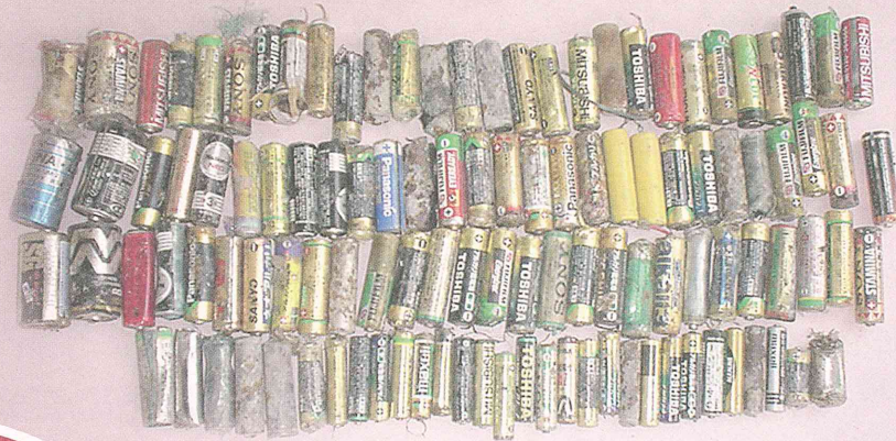
焼却灰の中から見つかった大量の電池