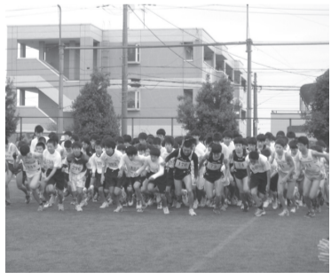
ロードレースの様子

12月1日（土）に行われた第50回日野市民体育大会ロードレースの記録により日野市の代表選手を決定いたしました。ロードレース当日は、代表選手を目標して、中学生は全力で走り抜きました。市内各中学校の2年生の中から補員も含めて、男女21名ずつ42名の代表選手を選出しました。