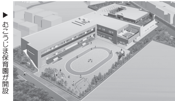
▶おこしほ保育園が開設

少ない原因と改善策について問う。 ▼子ども・子育て支援会議の二一調査の進捗状況について問う。 ▼地域協働アドバイザー経費と自治会インセンティブ補助金の財源について問う。 ▼子ども・子育て支援新制度事業について、専門部会の開催予定と日程を問う。 ▼法改正による市の就労促進対策の強化推進について問う。 ▼保育園を設置して、待機児を解消するべきではないか。 ▼自治会補助金の補助基準について問う。 ▼高齢者民間住宅家賃助成事業は、URを対象とするべきではないか。 ■衛生費／労働費 ▼今年度の市内一斉清掃事業は、どのような形で行うのか問う。 ▼専用水道等管理経費の財源について問う。 ▼骨粗しょう症検診で症状が判明したときの対応について問う。 ▼がん検診等事業が有料化されて受診率が下がっているが、未受診者への対応について問う。 ▼健康サポートルームの登録者数が増えているのに、経費が100万円増額されている理由を問う。 ▼ごみ処理施設建設整備経費のアドバイザー業務委託料と、PFI導入可能性調査見直し業務委託料の内容について問う。 ■農業費／商工費／土木費／消防費 ▼老朽化した街路灯の修繕で、平成26年度にLED照明にする街路灯の数について問う。 ▼健康器具設置工事で、設置される物・数・スケジュールについて問う。 ▼交通網整備支援経費について、増便、時間延長のために必要な予算を問う。 ▼七ツ塚公園整備のスケジュールと地域への説明について問う。 ▼街路灯の修繕の状況について問う。 ▼雪害に遭ったビニールハウスの再建支援の方向と、作物被害の補償について問う。 ■教育費／公債費／諸支出金／予備費 ▼学校体育館の非構造部分の耐震化について問う。 ▼有償ボランティア、市政協力を配置した学校図書館の現状について問う。 ▼小島善太郎記念館にかかるコストの削減に向けて、努力が必要だと思いが、今後の方針について問う。 ▼児童クラブの職員配置並びに補助金、支出金の状況について問う。 ▼幼稚園の就園奨励費の対象者が350人に拡大する