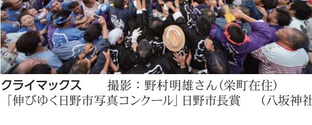
フライマックス 撮影：野村明雄さん(栄町在住) 「伸びゆく日野市写真コンクール」日野市長賞 (八坂神社)

新しい南平体育館の構想について 新しい南平体育館の構想について。 新しい南平体育館の構想について 新しい南平体育館の構想について。