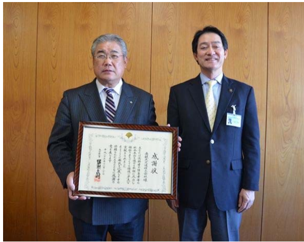
平成25年12月24日市長へ報告

平成25年12月20日に南観光交通(株)が「平成25年度東京都福祉のまちづくりに対する知事感謝状」を受賞しました。南観光交通(株)は日野市に創業して49年、業界でもいち早く福祉バスや福祉タクシーを取り入れ、現在は日野市内丘陵地の足を担う丘陵地ワゴンタクシーを運行する等、長年にわたり福祉事業に力を入れてきました。このことが評価され、東京都福祉のまちづくりに対する知事感謝状を受賞したものです。