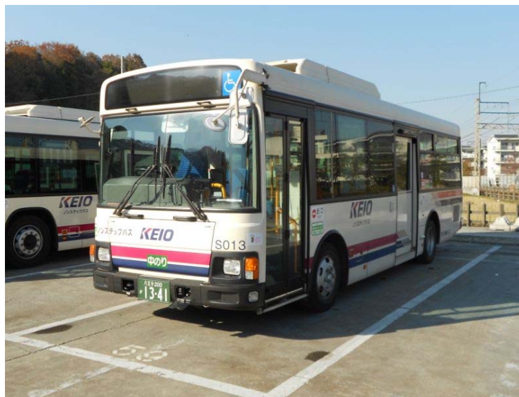
運行を開始した中型車両

平成26年3月1日より、予備車の車両代替えに伴い、市内路線・川辺堀之内路線において、中型車両の運行を開始します。該当車両が予備車のため、運行は不定期ではありますが、本運行について注視し、今後の車両中型化拡大に向けて参考としていきます。