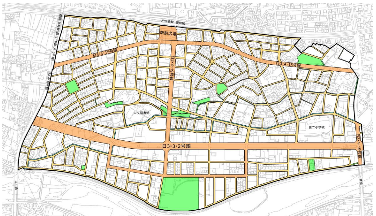
日野都市計画事業 豊田南土地区画整理事業設計図

日3・4・19号線 : W = 23 \text{ m} (7.0-9.0-7.0)